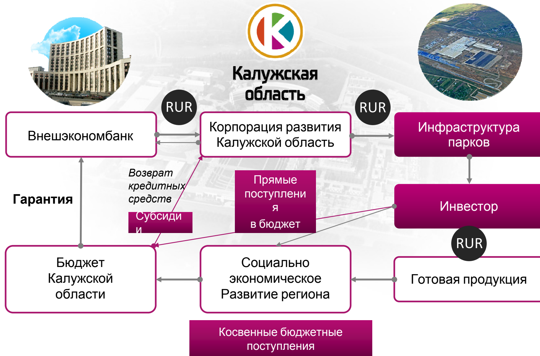
СХЕМА РЕАЛИЗАЦИИ ПРОЕКТА С УЧАСТИЕМ ВНЕШЭКОНОМБАНКА (ГЧП)