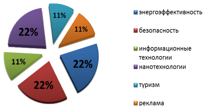
Сферы деятельности компаний-участников конкурса